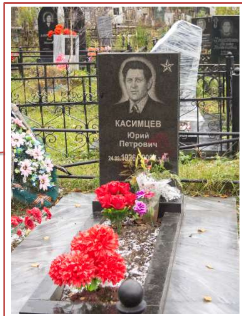
Ориентиры: Памятник хорошо виден со стороны дороги разделяющей 42-ой и 49-ый квадраты (смотреть по правую сторону)